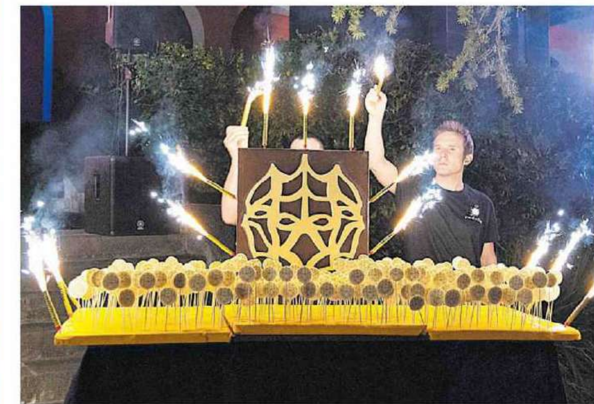
Los invitados disfrutaron de una amplia oferta gastronómica.

“La cultura catalana está bastante normalizada en todos los ámbitos, salvo en lo que respecta a la cinematografía. Tenemos que ponernos las pilas porque un país sin audiovisual no es un país completo”.