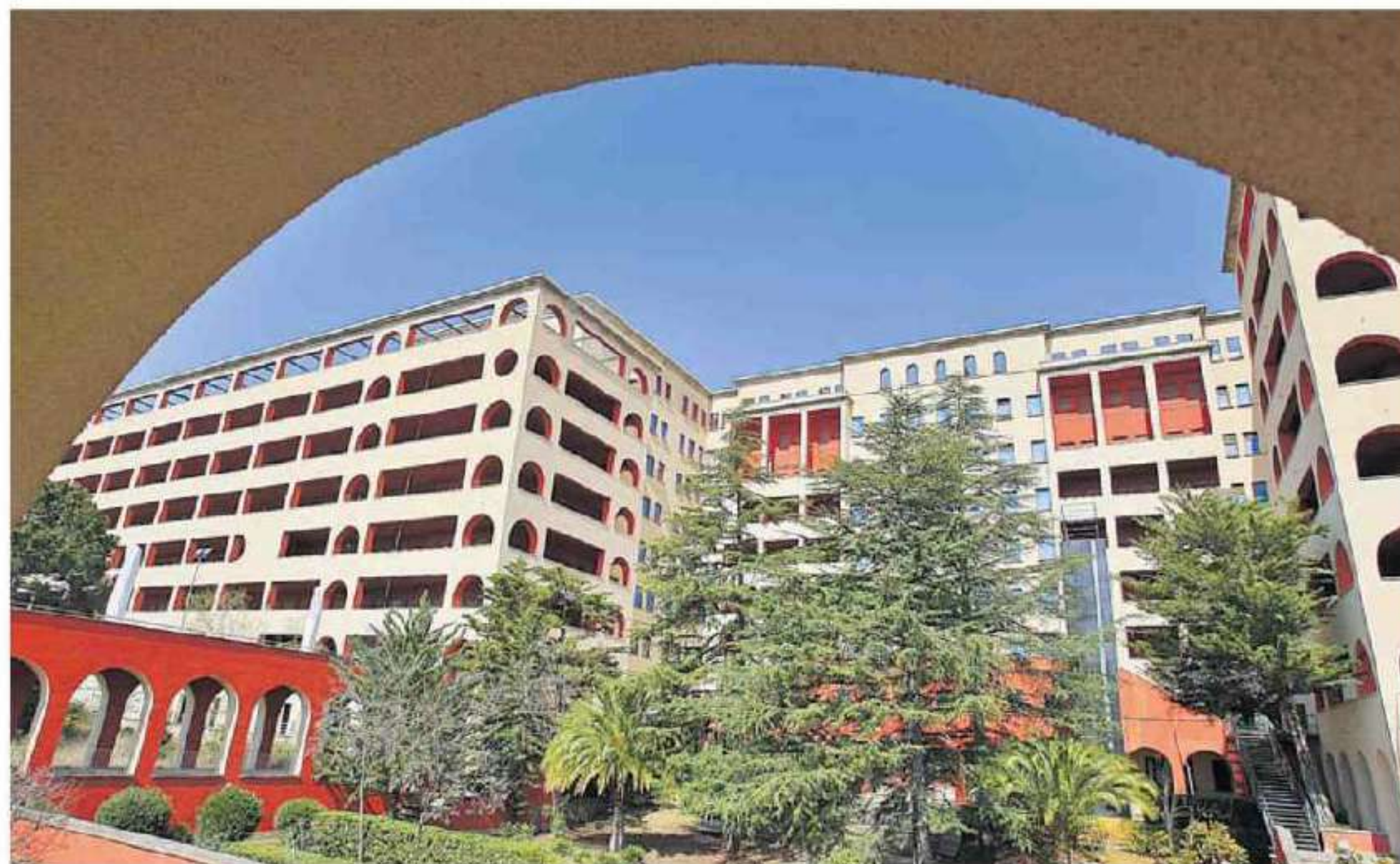
El Parc Audiovisual de Catalunya, que acogerá el gran evento del sector cinematográfico catalán.

La cineasta Isabel Coixet glosará la figura de Carme Elias, "buena amiga y protagonista de su bautizo en la dirección teatral, con '84 Charing