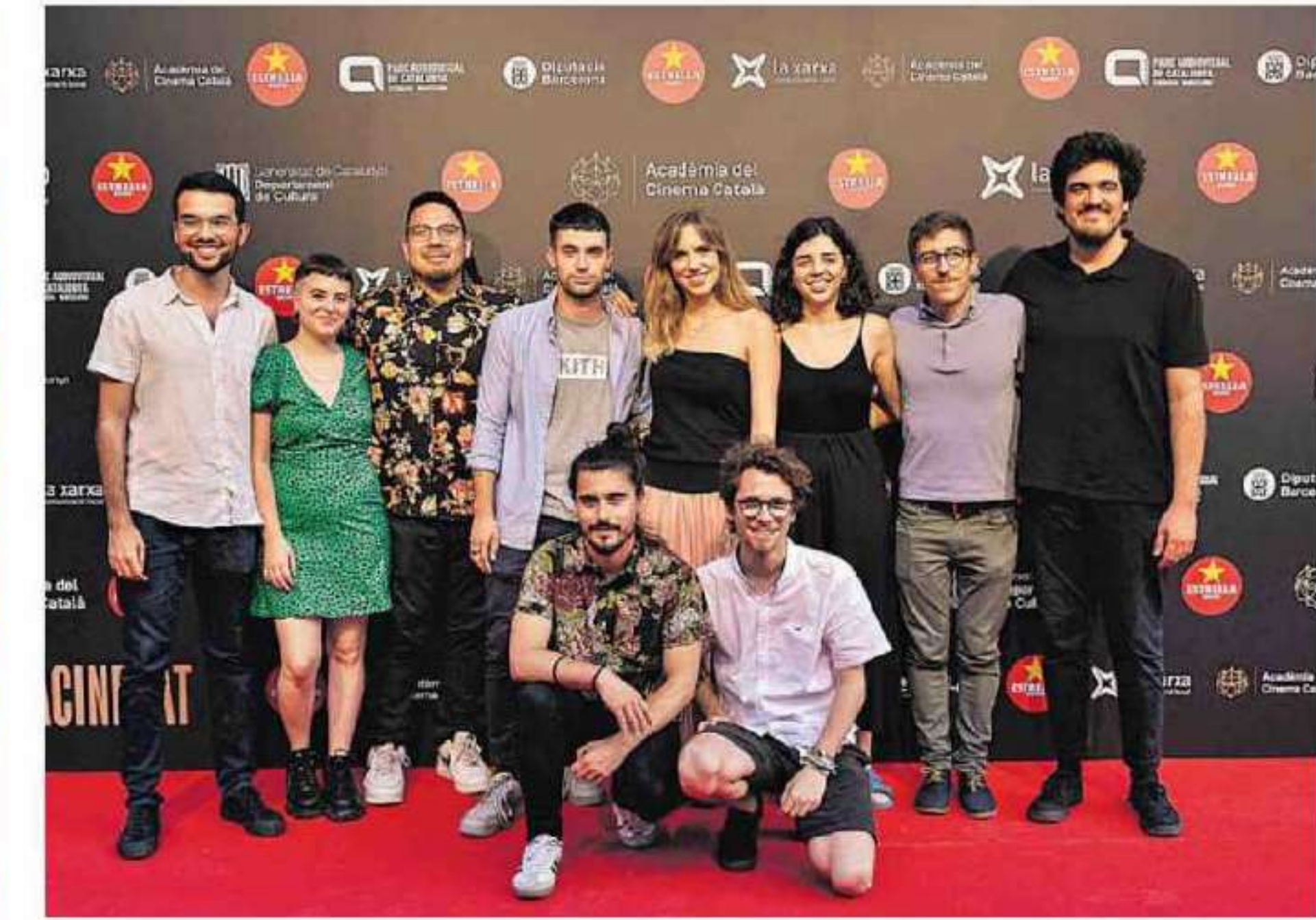
No faltó la tradicional "alfombra roja".