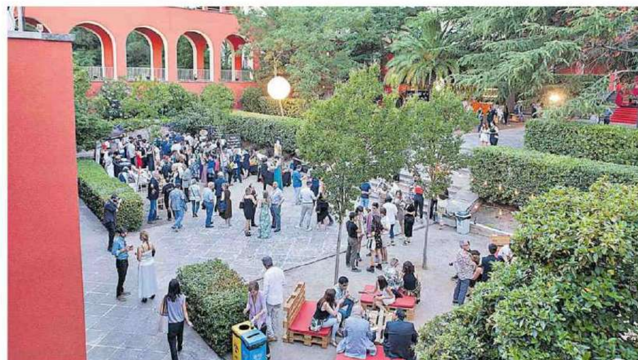
Los jardines del Parc Audiovisual se llenaron de profesionales del mundo del cine.